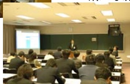
（全てはこの日のために）