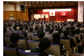
(記念講演も充実感があふれてました)