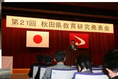
(開会式、所長の挨拶)