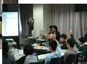
(子どもたちの授業提示という方法の発表もありました)