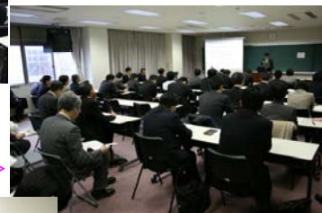
(県教育長も参加者と一緒になって)