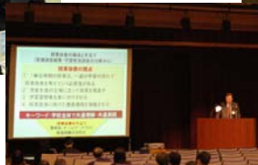
(プロジェクト研究2の発表)