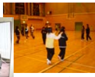
（グループ・エンカウンター！）