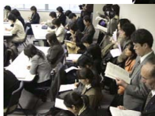
(発表会場はほとんどこの状態)