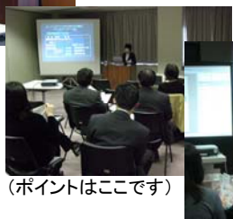
(ポイントはここです)