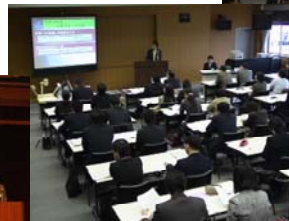
(プロジェクト研究3の発表)