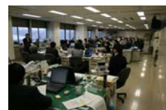
(この達成感を大切に)