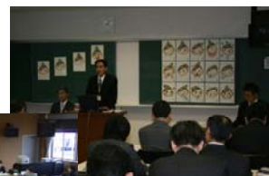
(グループ研究1の発表)