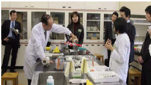
理科の授業改善 12月8日(土)

26講座に4日間で延べ258人の先生が参加しました。普段時間が取れない先生方にとって、よい機会だったという声を多数いただいております。