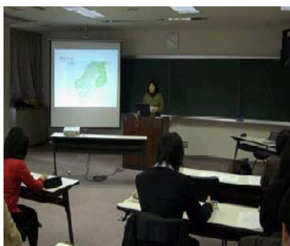
国語の授業改善 12月1日(土)

■ おもしろい講座を設けていただき、本当にありがたいです。会場が少し遠いため、おっくうになりがちですが、また是非、他講座も受講したいと思いました。分かりやすい説明や具体的な実践例、さらに「フィンランド国語教科書」の系統表を作成しての説明、ありがたい限りです。(横手市 I先生)