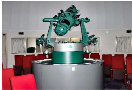
当センターのプラネタリウム室