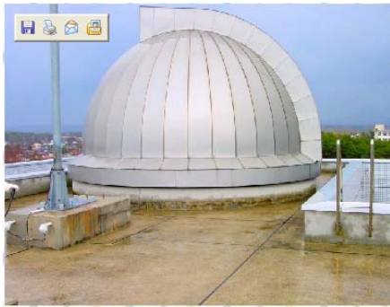
当センターの屋上天体観測室(外側)