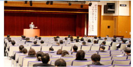
昨年度の公開講演の一コマ

公開講演は、秋田県総合教育センターで行う研修講座の中から、その講座の受講者以外の教育関係者や広く県民の方々にも、優れた英知に直接触れる場を提供することを目的に開設するものです。今年度も次のとおり行いますので、どうぞお問い合わせの上ご参加ください。