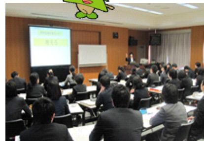
←小学校初任者研修講座の一コマ