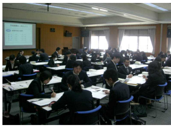
【A-1・2・3・4】 初任者研修講座

「経験年次別研修」「職務別研修」「専門的実践力向上研修」からなる基本研修講座です。互いに高め合いながら、実践的指導力や学校運営参加力の向上を図ることを目的として実施しております。