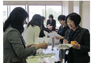
【C-14】 小中連携を意識した 小学校外国語活動

所属長の承認を得て、希望者が自主的に受講する講座です。教材の工夫や授業づくり・学級づくりのヒント、教育相談の手法や教員としてのスキルアップを図る講座等を実施しております。