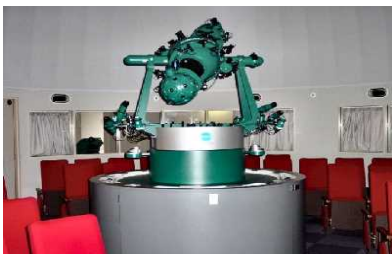
★当センターのプラネタリウム室★

天体望遠鏡での星空の観察や星座早見盤の製作、天体シミュレーションの体験、プラネタリウムでの学習会、太陽系についてのクイズや展示を行います。是非この機会に、夏の星空をお楽しみください。