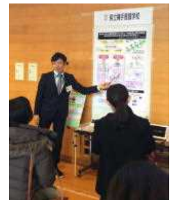
平成26年度ポスター発表の様子

二日間にわたり、発表者と参加者が一堂に会するポスターセッション形式の研究発表を行います。聞き手が興味ある発表を選んで聞き、発表者と気軽に意見を交換しながら研究成果を共有できます。