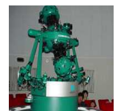
当センターのプラネタリウム

県内の各学校は当センターのプラネタリウム室を利用することができます。お気軽にお問い合わせください。(問合せ先は，上記プラネタリウム教室と同様です。)