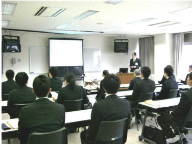
中学校「学級づくりについて」

当センターの研修講座は秋田県教職員研修体系に基づき、教職員一人一人のライフステージや職務に応じて総合的・体系的に実施しています。4月17日（月）に今年度の研修講座がスタートし、新設講座の一つである「講師等研修講座A」が行われました。