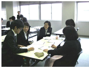
小学校「学級づくりについて」