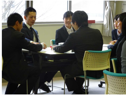
初任者研修講座(高等学校)Ⅰ 「授業づくりの基本」