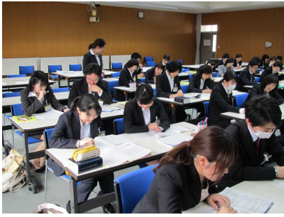
初任者研修講座(小学校)Ⅰ 「生き生きとした学級経営」

当センターの研修講座は平成30年度秋田県教職員研修体系に基づき、教職員一人一人のキャリアステージや職務に応じて総合的・体系的に実施しています。