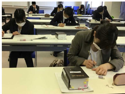
特別支援学校講師等研修講座A 「教育公務員の服務」