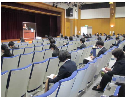
初任者研修講座(中・高・特支) I

4月20日（水）の初任者研修（小学校Aグループ）Iを皮切りに、令和4年度の研修講座がスタートしました。当センターの研修講座は、秋田県教職員研修体系（令和4年一部改訂、秋田県教育委員会）に基づき、教職員一人一人のキャリアステージや職務に応じた資質能力の向上を目指し、総合的・体系的に実施しています。昨年度に引き続き感染症対策を講じながら、受講者が主体的に研修に取り組むことのできる講座を実施します。