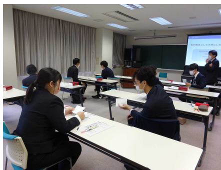
高等学校講師等研修講座 A