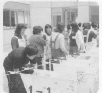
専門研修講座 (平成16年度 図画 工作科)