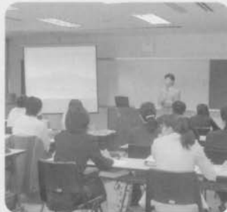
基本研修講座 (平成16年度 小学校初任者研修)