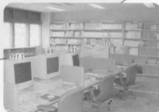
教育用ソフトウェアライブラリー (総合教育資料室)