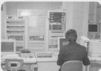
情報教育支援 (コンピュータ室)