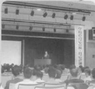
公開講演 (平成16年度 6月)