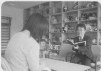
教育相談 (プレイルーム)