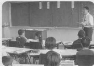
スタディイン総合教育センター (平成16年度 国語科)