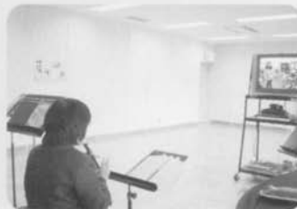
インターネットTV授業 (平成16年度 音楽科)