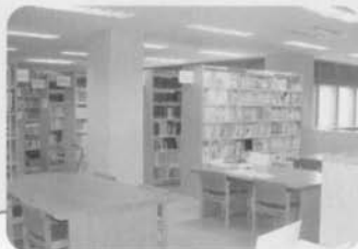
教育関係図書・研究物等教育資料 (総合教育資料室)