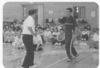
施設・設備の開放 (平成16年度 防犯教室)