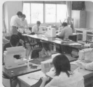
専門研修講座 (平成16年度 家庭科)