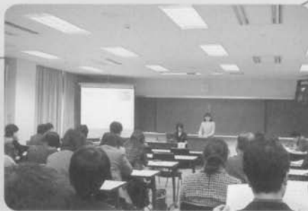
教育研究発表会 (平成15年度 分野別研究発表)

プロジェクト研究、共同研究、 所員研究など、グループや個人 で研究を進めています。