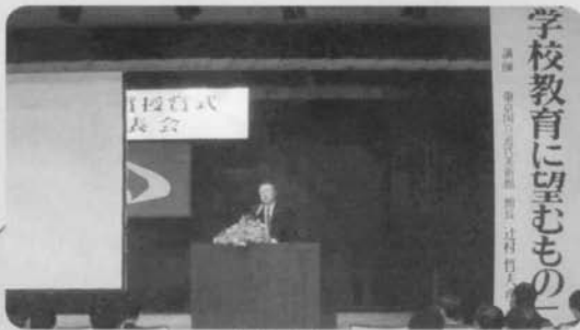
教育研究発表会 (平成15年度 記念講演)