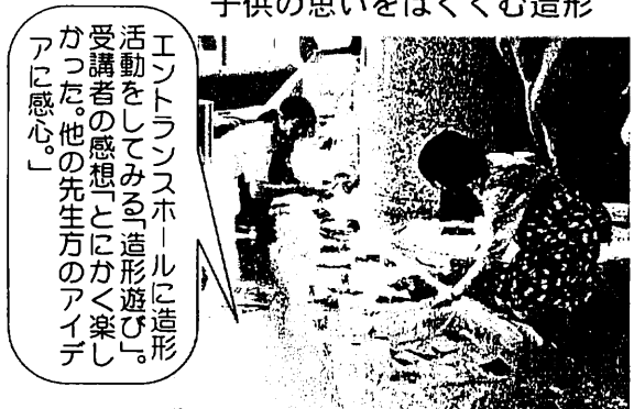
子供の思いをはぐくむ造形

エントランスホールに造形活動をしてみる「造形遊び」。受講者の感想とに「楽しく楽しかった。他の先生方のアイデアに感心。」