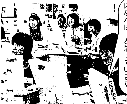
はじめて触れるパソコン

パソコンの電源を入れることから始めています。2日間ですぐ上達する人もいて驚いています。みんなが使えるようになれば、と思っています。