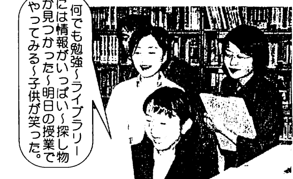
特殊教育学校初任研

何でも勉強、ライブラリーには情報がいっぱい、探し物が見つかると明日の授業でやってみる、子供が笑った。