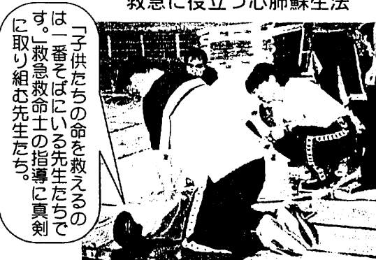
救急に役立つ心肺蘇生法

「子供たちの命を救えるのは一番そばにいる先生たちです。」救急救命士の指導に真剣に取り組む先生たち。