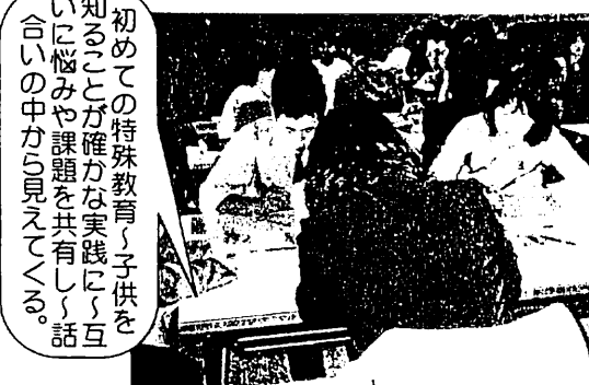
小・中学校特殊学級新担任研修

初めての特殊教育、子供を知ることが確かな実践に、互いに悩みや課題を共有し、話し合いの中から見えてくる。