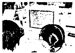
【電子掲示板の学習】

ビデオレターの呼びかけに、小学校1校、県立養護学校1校がこの交流に協力してくださいました。