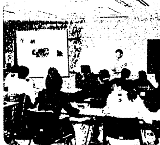
基本研修講座 (平成16年度 小学校初任者研修)