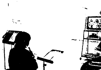
インターネットTV授業 (平成16年度 音楽科)