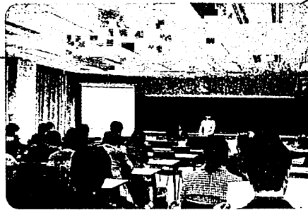
教育研究発表会 (平成15年度 分野別研究発表)

プロジェクト研究、共同研究、 所員研究など、グループや個人 で研究を進めています。