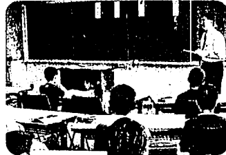
スタディイン総合教育センター (平成16年度 国語科)