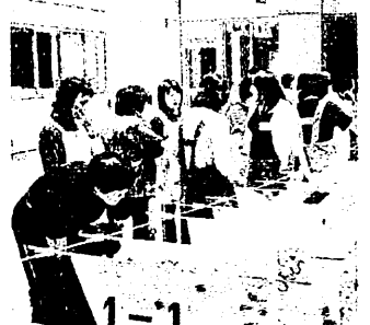
専門研修講座 (平成16年度 図画・工作科)