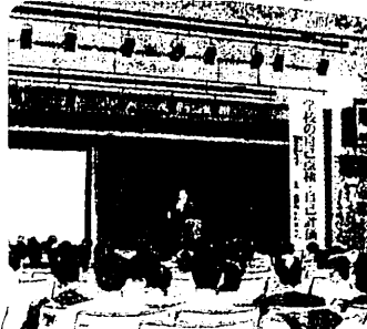
公開講演 (平成16年度 6月)