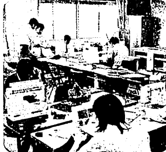
専門研修講座 (平成16年度 家庭科)