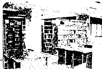
教育関係図書・研究物等教育資料 (総合教育資料室)