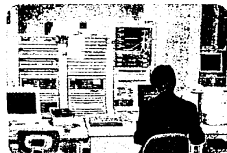
情報教育支援 (コンピュータ室)