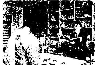
教育相談 (プレイルーム)