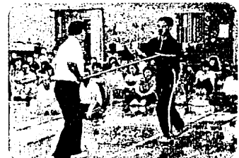
施設・設備の開放 (平成16年度 防犯教室)