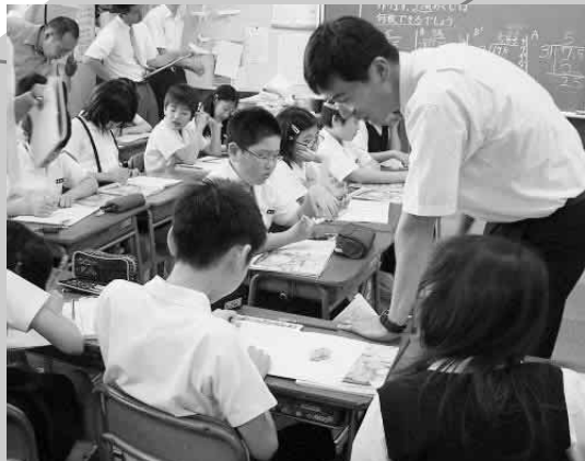
算数科における授業改善（6/17） 秋田大学教育文化学部附属小学校