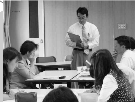
新任生徒指導主事研修講座（6/15） ～協議風景～

児童生徒や保護者等との教育相談やかかわり方に、具体的に役立つ講座を目指しています。ブリーフセラピーでは東北の第一人者である、弘前大学教育学部助教授柴田健先生の講座や、アドラー心理学を中心としたカウンセリングの、日本を代表する実践者である（有）ヒューマン・ギルド代表取締役岩井俊憲先生による講座も開設します。まだ受講可能な講座もありますので、希望者はご確認の上、お申し込みください。 （児童生徒支援班 018-873-7205）