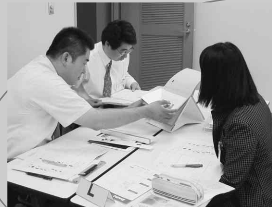
障害児理解のための心理検査（6/3） ～K-ABC知能検査の演習～

教職員のニーズにダイレクトにこたえられるよう、最近の動向をふまえた講座を開設しています。自閉症や軽度発達障害、作業学習の授業改善や進路支援等をテーマとした内容です。受講した方が自ら気付き、共感をもって協議し合い、受講後もつながりをもって支え合えるような講座を目指しています。（特別支援教育班 018-873-7215）