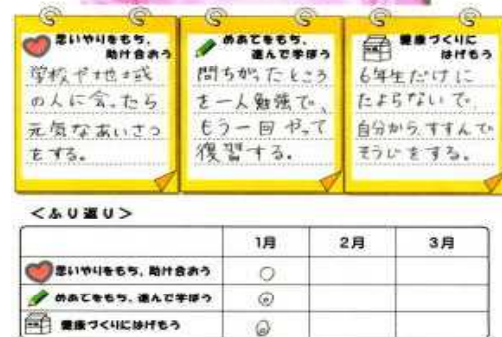
3学期のめあてカード